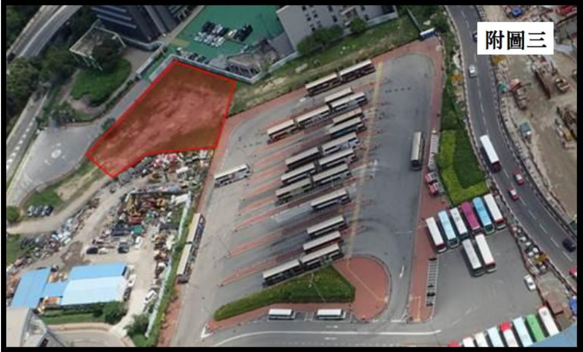
徵用渡華路巴士站旁之支援工地至2017年年底