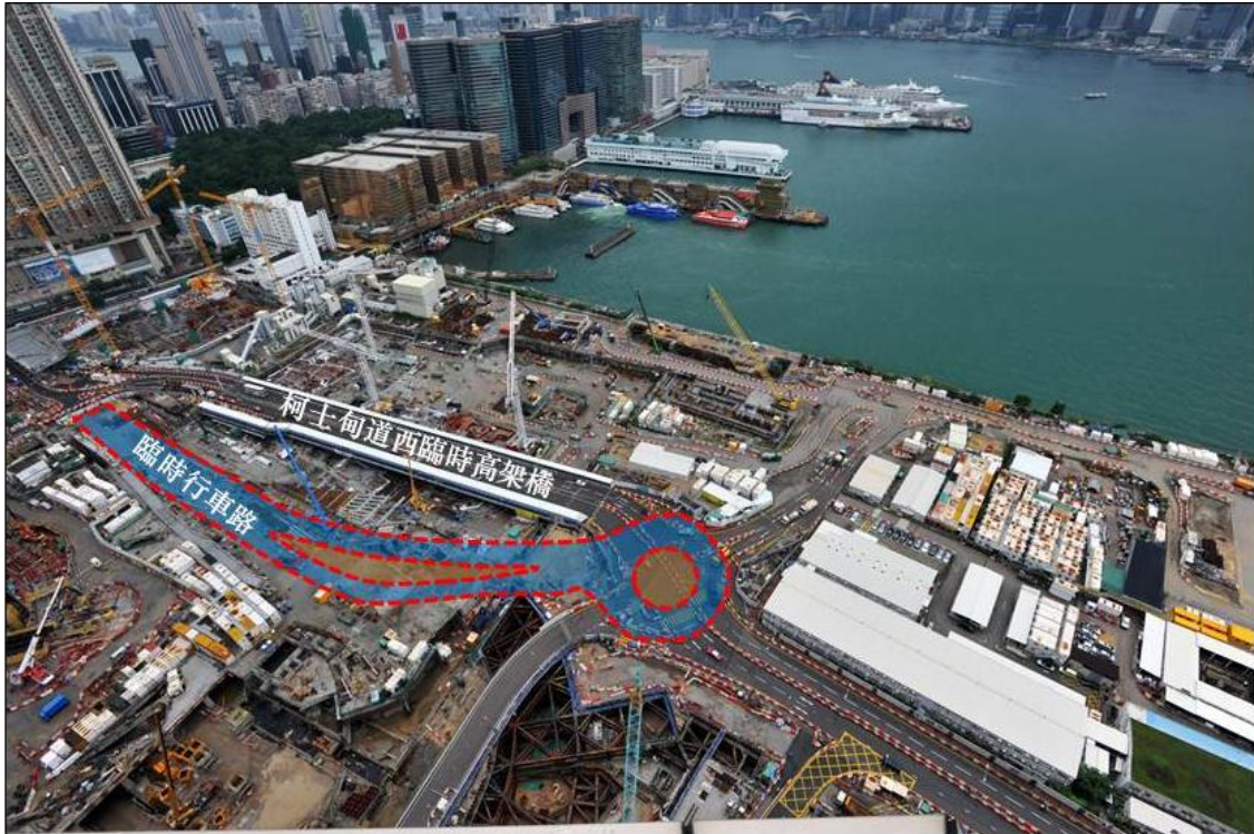
附圖一 柯士甸道西與連翔道交界之迴旋處將於9月期間設置、匯民道與連翔道的一段柯士甸道西預計於2015年10月改道