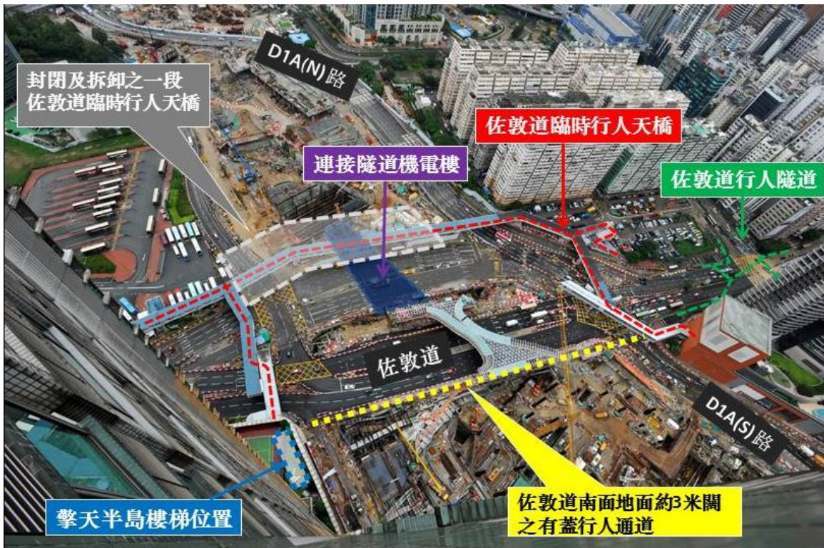
附圖二 佐敦道臨時行人天橋封閉後，行人可由佐敦道行人隧道、柯士甸站替代行人道橫過D1A(S)路往擎天半島地面之樓梯再往九龍站一帶