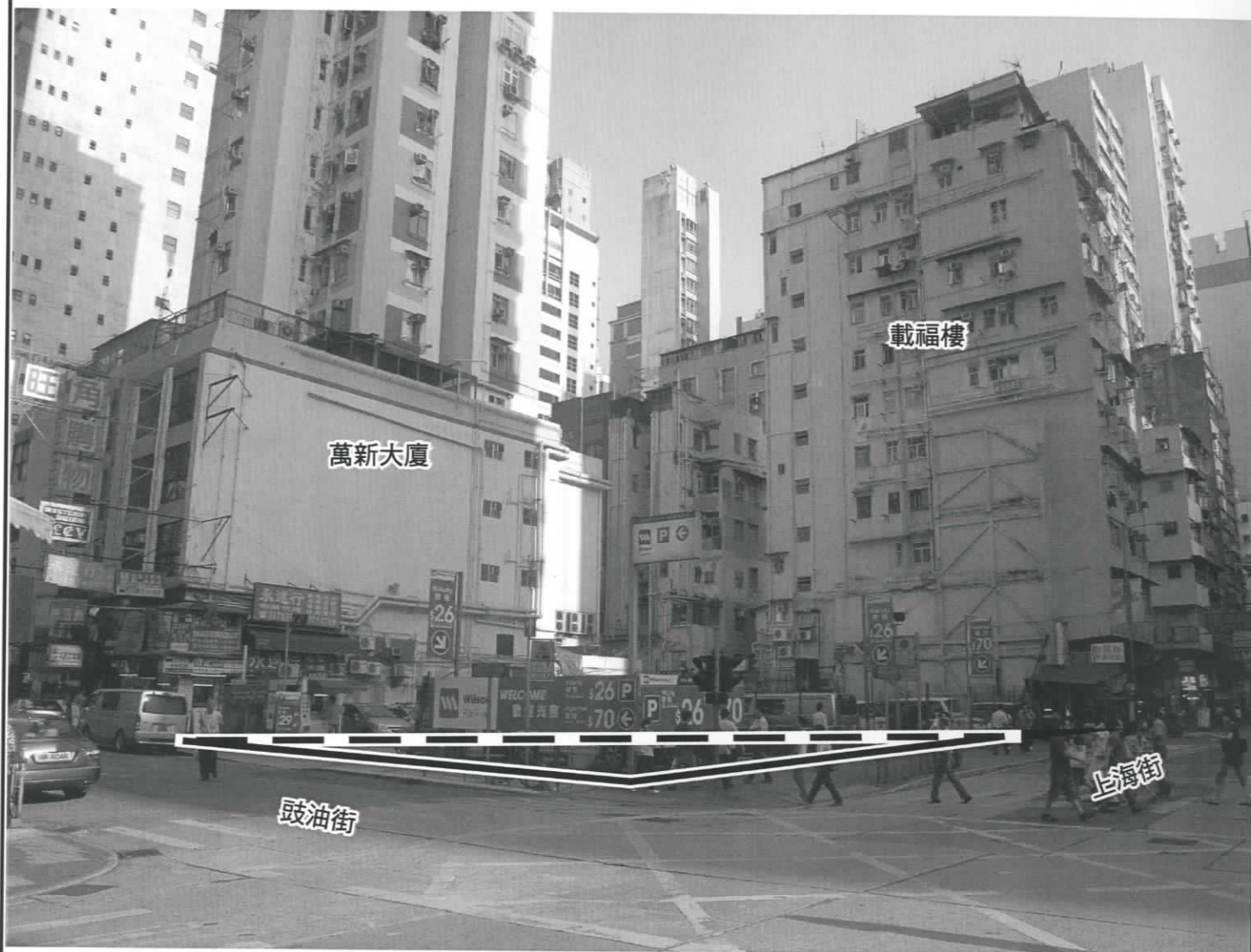
照片 1 — 豉油街用地