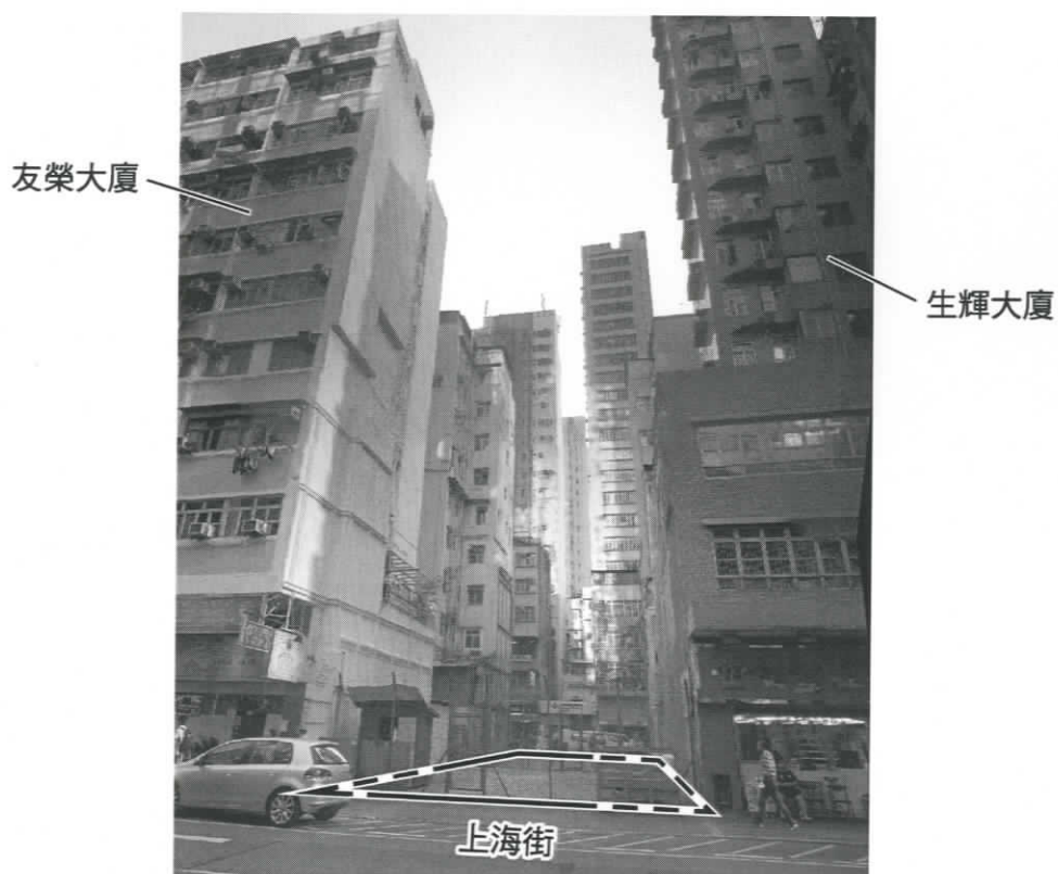
照片 3 — 新填地街／上海街（由上海街望）