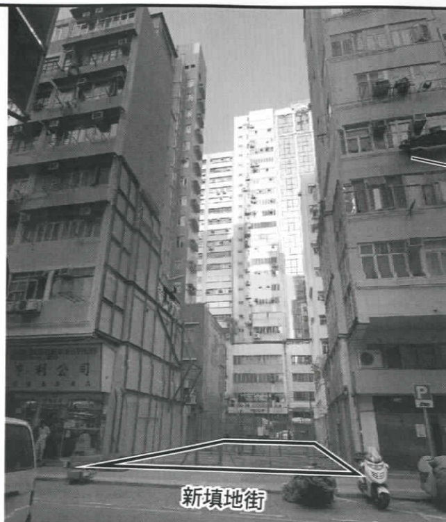
照片 2 — 新填地街／上海街（由新填地街望）