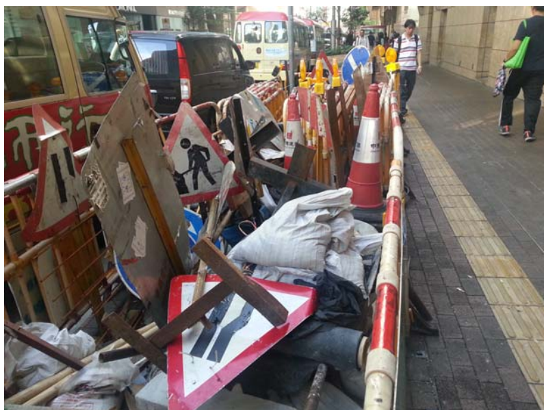
圖一：上海街旺角社區會堂對出行人路