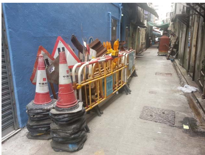
圖三：碧街上海大廈 後巷