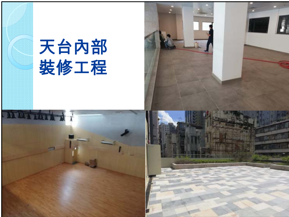
天台內部 裝修工程