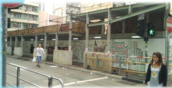
Beautified hoarding to show more project information