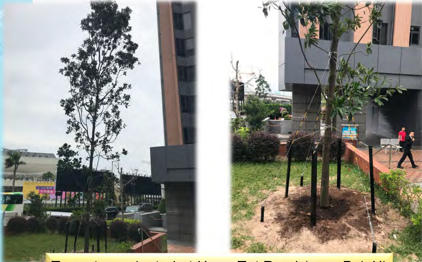
Trees transplanted at Hong Tat Road (near PolyU)