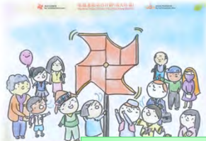
2 nd Runner up