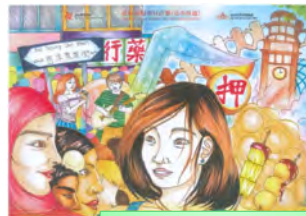
2 nd Runner up