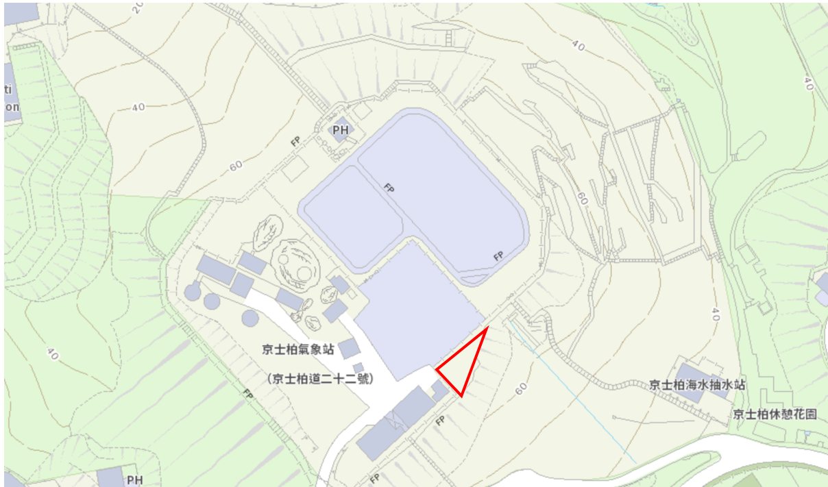
圖三：建議併入康文署管理範圍的三角型空地